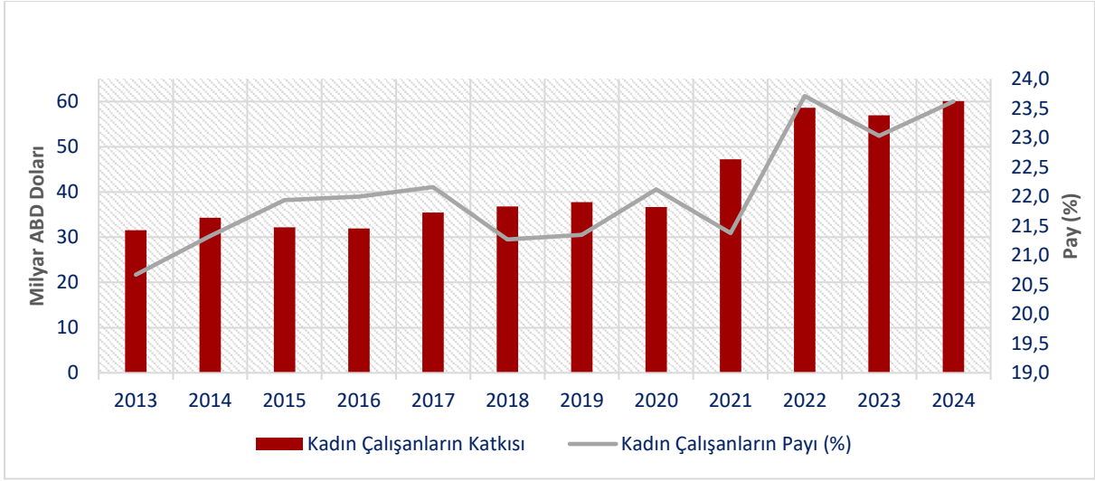
Grafik 2: Kadın alıřanların İhracata Katkısı ve Toplam İhracattaki Payı

2024 yılında kadın alıřanların ihracata katkısı, 2013 yılına kıyasla yaklaşık iki kat artarak 60,1 milyar dolara ulaşmış ve toplam ihracattaki payı %23,6 olmuřtur.